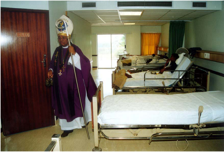
Anschließend ging Bischof Biyase durch Blessed Gérard's Hospiz und segnete all die erweiterten Krankenzimmer.