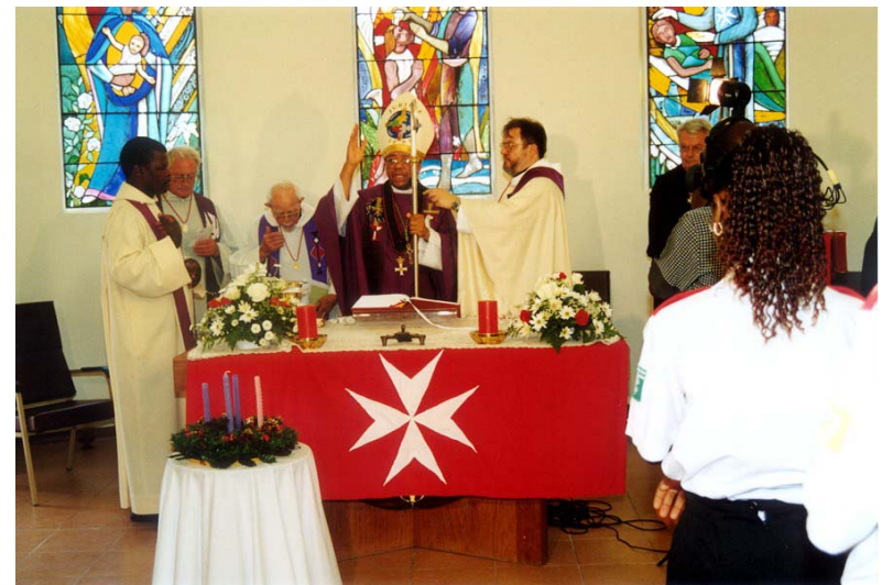
Am Ende der Hl. Messe segnete Bischof Mansuet das neue Gebäude für Blessed Gérard's Kinderheim und die Erweiterung des Blessed Gérard's Hospizes.