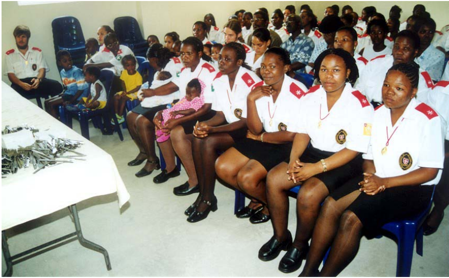
Einige der Mitglieder der Bruderschaft des Seligen Gerhard.