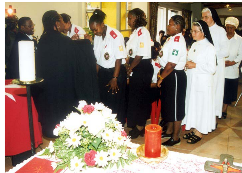
Die Neumitglieder empfangen die Medaille der Bruderschaft des Seligen Gerhard.