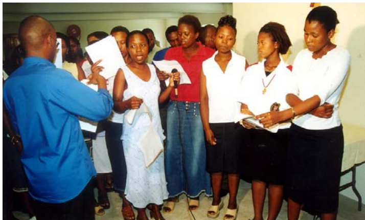
Der Jugendchor Sundumbili singt ein Segensgebet für Afrika.