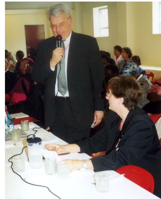
Frä Ludwig Hoffmann von Rumerstein eröffnete das Blessed Gérard's Kinderheim und die Erweiterung des Blessed Gérard's Hospizes offiziell und dankte allen Leuten, die zur Verwirklichung beigetragen haben.