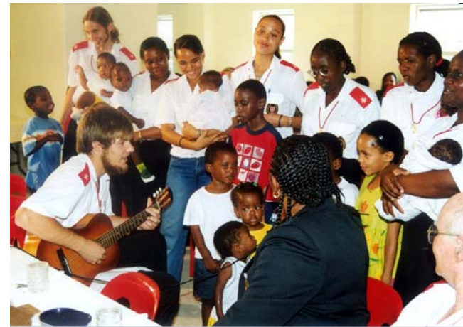
"Danke für diesen guten Morgen, ... danke, daß ich all meine Sorgen auf Dich werfen mag ... danke für meine Freunde und Brüder ... danke für jedes kleine Vergnügen ... danke für alles!" gesungen von den Kindern des Blessed Gérard's Kinderheimes in Dankbarkeit.