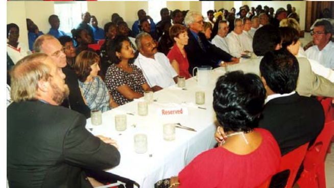
Einige der VIPs die am Empfang teilnahmen.