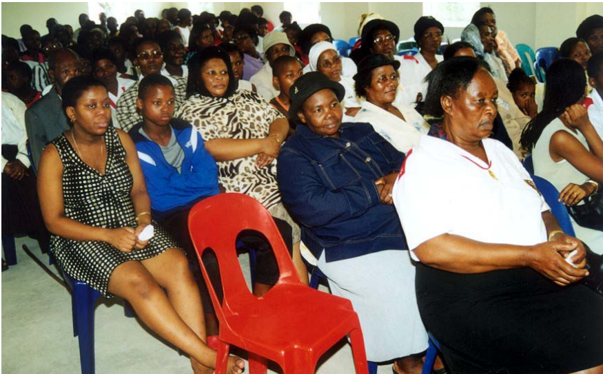
Einige der Gäste während des Empfangs.

Einigen der größeren Spender wurde für ihre geschätzte Hilfe besonders gedankt: Der Aktion Dreikönigssingen, Whirlpool, Nampak, der Südafrikanischen Zuckergesellschaft, Loungefurn, SEC Electrical