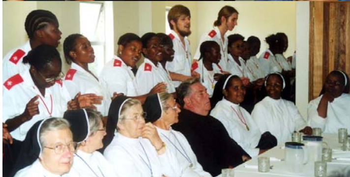
Aktive Mitglieder der Bruderschaft des Seligen Gerhard drücken ihre Freude und Gemeinschaft in Gesang und Tanz aus.

Das Ehrenzeichen der Bruderschaft des Seligen Gerhard wurde an folgende Mitglieder verliehen: