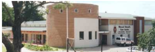
Blessed Gérard Care Center, Mandini,

Nach dem Seligen Gérard Tonque, dem Gründer des Malteserordens